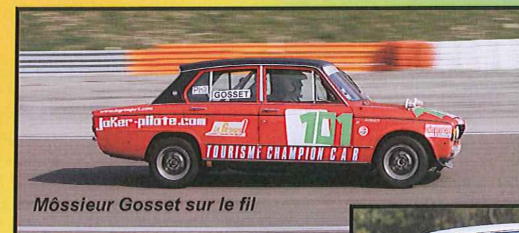
Môssieur Gosset sur le fil