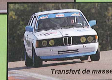
Transfert de masse

Dijon Prénois sans doute le plus beau circuit de vitesse de la saison où les moyennes au tour atteignent près de 140 Km/h avec nos « petites » autos. En tout cas celui préféré de l'auteur de ces lignes. Si seulement la chaleur de l'accueil et l'organisation étaient à la hauteur du tracé !